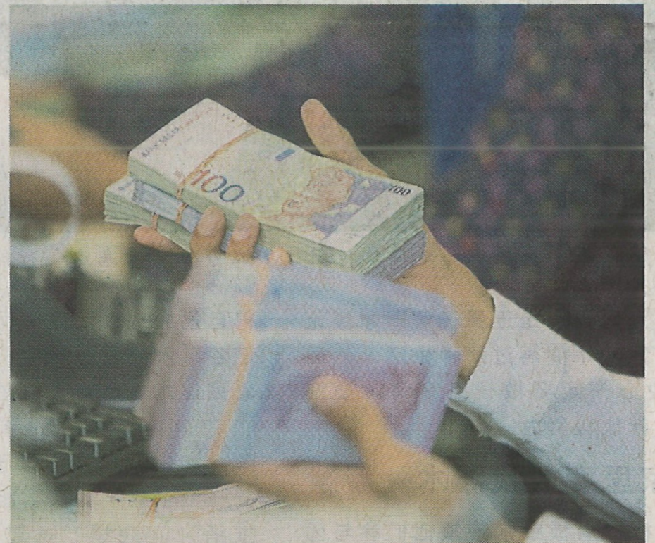
过高的奖励，可能会损害股东价值和对公司公司监管实践的信任。

薪酬与激励委员会是维持上市公司监管标准不可或缺的组成部分。他们负责确保薪酬和激励计划透明、公平，并与公司的长期目标保持一致。