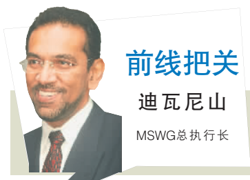
前线把关 迪瓦尼山 MSWG 总执行长